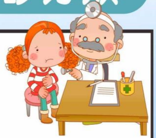
前十位及病患看診人次